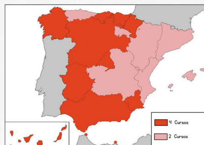
Cursos en los que se imparten los contenidos.