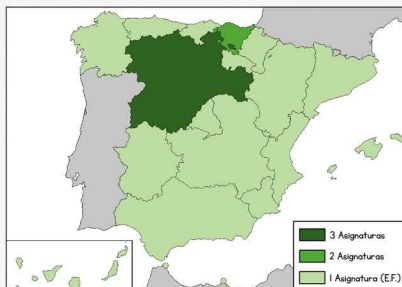
Asignaturas en las que se imparten los contenidos.

Actuar de acuerdo a los protocolos de intervención ante situaciones de emergencia o accidentes aplicando medidas específicas de primeros auxilios.