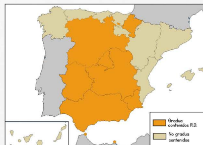
Graduación de los contenidos desde 1º hasta 4º curso de ESO.