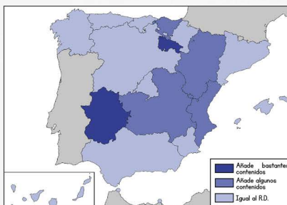
Incremento de los contenidos con respecto al RD 217/2022.