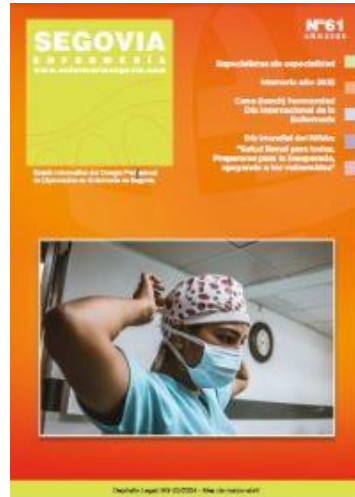
marzo – abril