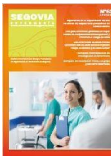
Septiembre – octubre