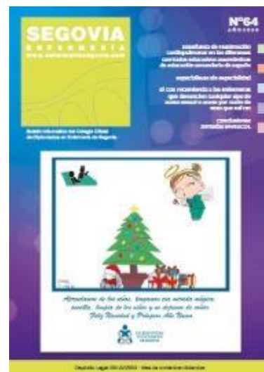
noviembre - diciembre